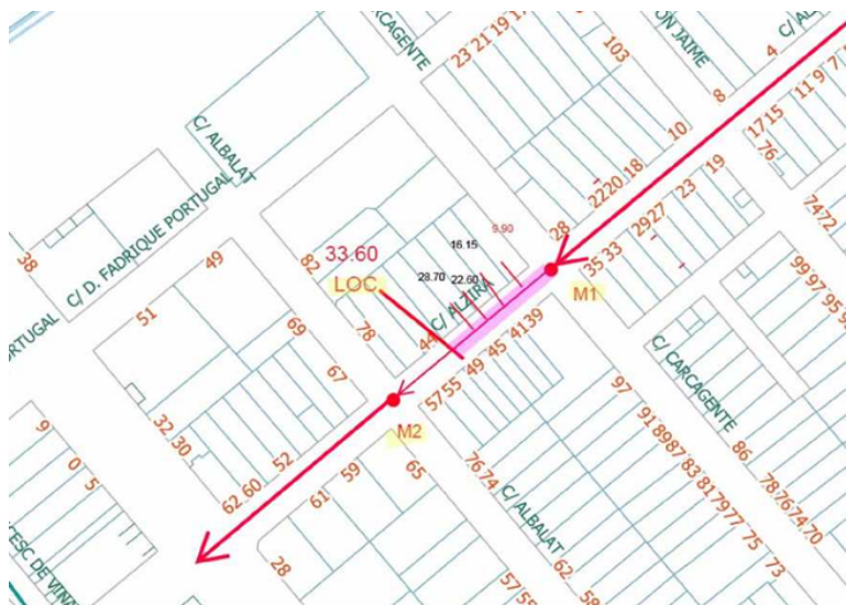
Plano de la inspección realizada

Se analiza el tramo de saneamiento del ramal dispuesto en la calle Alzira comprendido entre los pozos de saneamiento situados en los cruces con las calles Carcaixent y Albalat