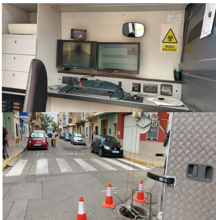
Imágenes de introducción en pozo de saneamiento de cámara. Alzira con Carcaixent

De la inspección realizada se adjuntan fotografías de las condiciones del ramal y principal, acometidas domiciliarias y sección tipo del ramal inspeccionado;